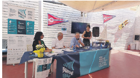
La conferenza stampa di presentazione tenutasi ieri mattina

«Si tratta di un'importante vetrina promozionale per raccontare la storia di donne e uomini che hanno un legame profondo con il mare - afferma il