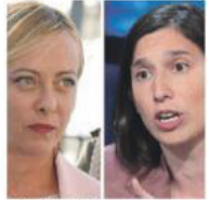
Meloni e Schlein

ROMA. Dura poco il disguido sperato sul salario minimo, dopo lo spiraglio aperto da Giorgia Meloni per un dialogo con le opposizioni sulla misura finora duramente contrastata dai suoi ministri e liquidata come «assistenzialismo vetero-sovietico». La disponibilità della premier - accolta al voto da Elly Schlein, pronta a incontrarla «anche domattina» - si infrange sull'emendamento della maggioranza che alla Camera punta a cancellare il salario. Il ritiro di quell'emendamento è la prova del nove che i dem prendono subito, per sedersi al tavolo. Ma martedì - quando la commissione Lavoro di Montecitorio potrebbe votarlo - non ci sarà alcun ritiro. Anzi, Fratelli d'Italia rilancia e suggerisce di rinviare l'approdo in Aula previsto il 28 luglio. Sembra così stopparsi, sul nascere, l'ipotesi di uno «scambio» sul sostegno minimo ai lavoratori, rinviando la discussione a settembre. Resta dunque acceso lo scontro sul provvedimento al centro di una proposta di legge firmata dal M5s e sostenuta da tutte le opposizioni, riu-scite