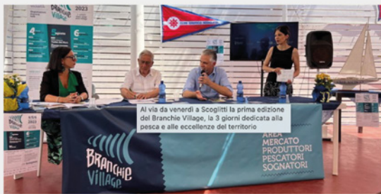
Al via da venerdì a Scoglitti la prima edizione del Branchie Village, la 3 giorni dedicata alla pesca e alle eccellenze del territorio

Tanti i partner della manifestazione che ha potuto contare su importanti sponsor quali Virtu Ferries (main sponsor), Banca Agricola Popolare di Ragusa ed Enegean.